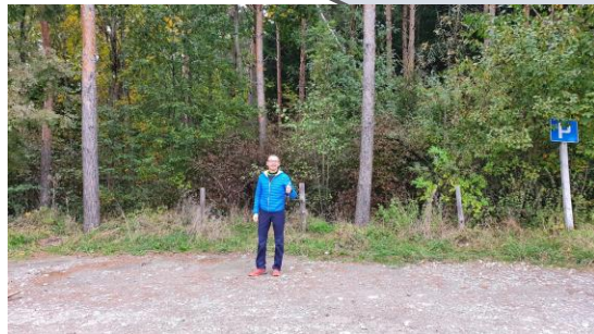
Arrivée + Ravitaillement (La Tuffière), 10 km