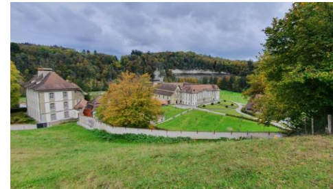
5.5 km (Abbaye d'Hauterive FR)