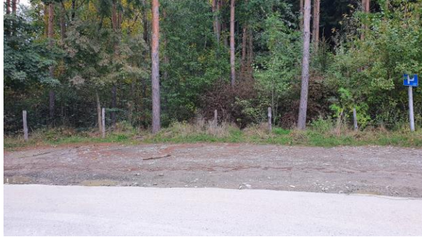
Départ + Ravitaillement (La Tuffière)